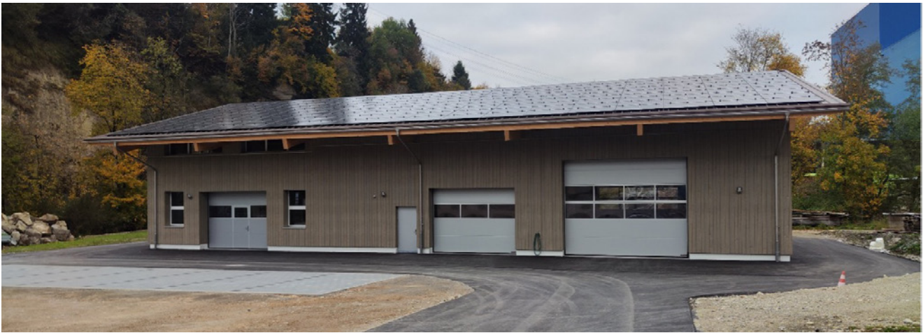
Abbildung 3: Aussenansicht Werkhof

zu vergeben. Dieses Versprechen gegenüber der Bevölkerung konnte bei nahezu allen Arbeitsgattungen eingehalten werden. Damit blieb ein wesentlicher Teil der Wertschöpfung in der Region und stärkte das lokale Gewerbe nachhaltig.