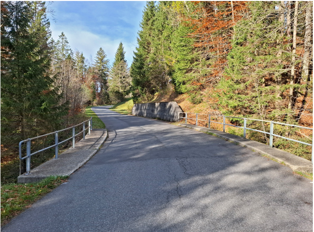
Abbildung 5: Kunstbaute Gfellenbach

Der Projektperimeter erstreckt sich von Finsterwald bis zur Stillaubbrücke und umfasst eine Länge von rund 4 km. Die Strassenanlage wurde in den 1980er Jahren ausgebaut. Nebst dem betrieblichen Unterhalt erfolgten bis anhin keine Sanierungsarbeiten. Die durchgeführten Zustandsanalysen an mehreren Kunstbauten, Stützmauern sowie diversen Durchlässen zeigen erhebliche bauliche Defizite. Zusätzlich besteht aufgrund zunehmender Niederschlagsintensitäten infolge des Klimawandels ein erhöhter Anpassungsbedarf bei der Entwässerungsinfrastruktur. Ziel ist es, die Verkehrssicherheit langfristig zu gewährleisten und die Substanz der Strassenanlage nachhaltig zu sichern.