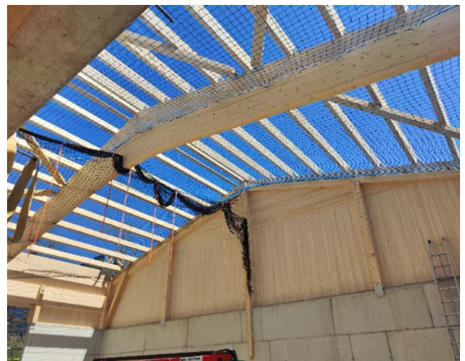
Abbildung 1 und 2: Holzkonstruktion Dach Werkhof