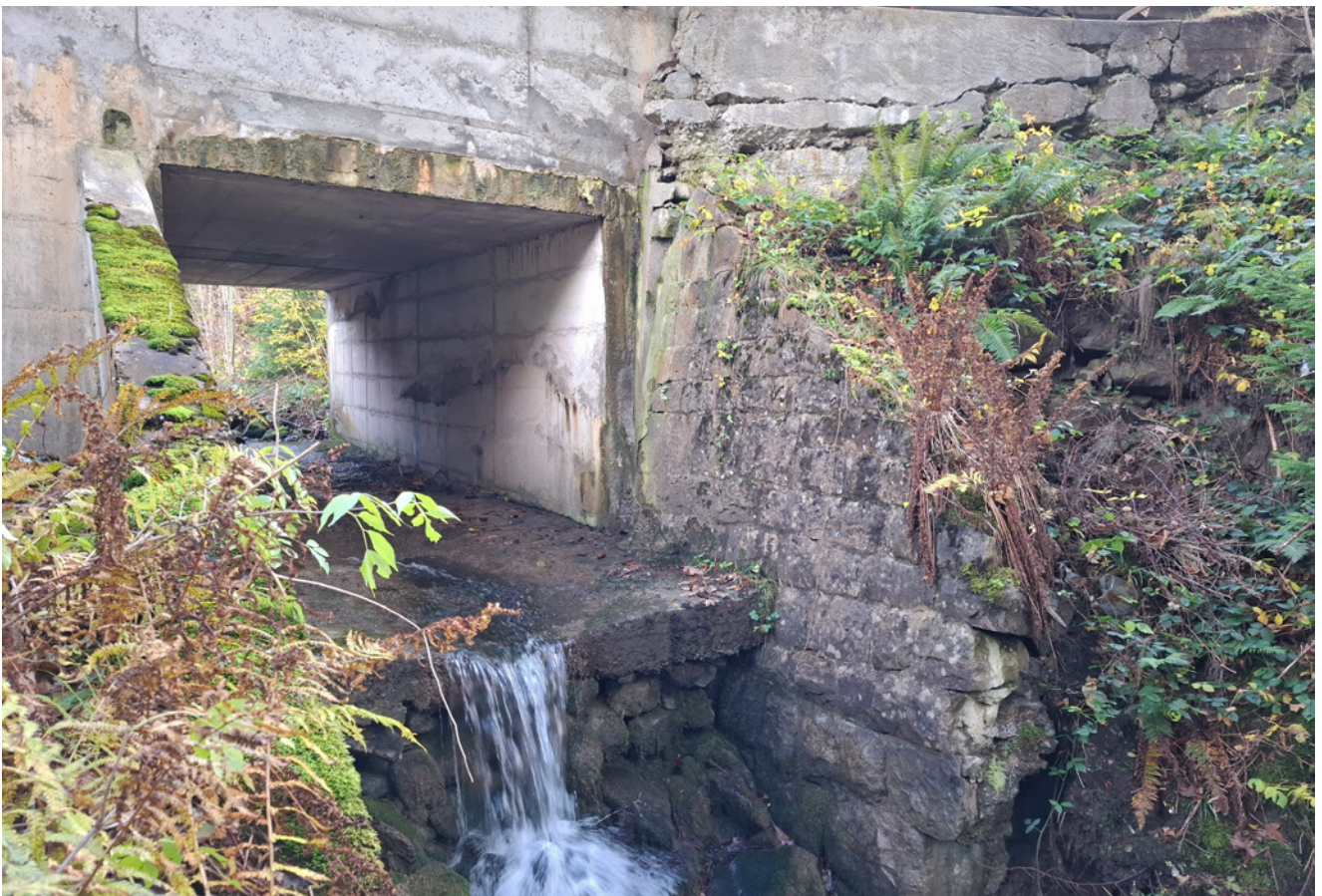
Abbildung 4: Sanierungsquerschnitt Kunstbauwerke

2020 war die Realisierung des Kanalisationsanschlusses für den Weiler Gfellen vorgesehen. Aufgrund verschiedener Abklärungen über die weiteren Sanierungsabsichten in diesem Gebiet sowie des teilweisen Rückzugs beteiligter Werke konnte das Projekt bisher nicht wie vorgesehen umgesetzt werden. Inzwischen hat sich der Zustand der gesamten Strassenanlage – einschliesslich Strassenentwässerung, Stützbauwerke und Brücken (Kunstbauten) – deutlich verschlechtert. Insbesondere der Asphaltoberbau befindet sich über weite Strecken in einem baulich ungenügenden Zustand. Der Deckbelag weist Risse sowie grosse Unebenheiten auf und ist teils bis auf die Tragschicht ausgebrochen. Zudem entsprechen einzelne Abschnitte hinsichtlich Querschnittsbreite sowie Oberflächenentwässerung nicht mehr den heutigen betrieblichen und sicherheitstechnischen Anforderungen. Der schlechte Gesamtzustand macht eine umfassende Gesamtsanierung daher unumgänglich.