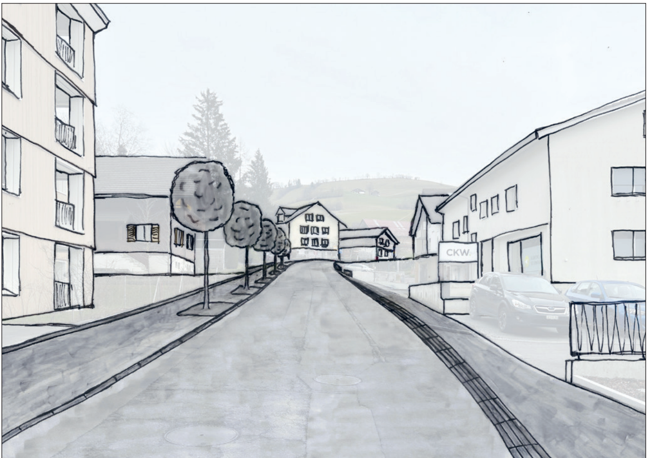
Abbildung 2: Visualisierung Gestaltung Glaubenbergstrasse, Stand 28.02.2025